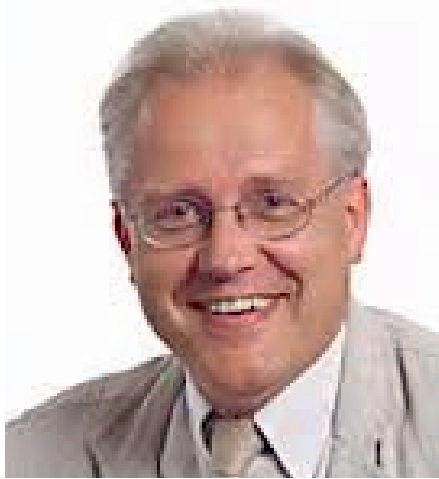
Hans-Peter Martin, österrikisk journalist, författare och politiker. Har varit ledamot av Europaparlamentet sedan 1999. Återkommande medarbetare i Der Spiegel.

Författarna hävdar att det inte finns någon sammansvärjning, ingen kartell av profithungliga banker som träffas i hemliga kretsar i slutna rum. De menar att allt händer på finansmarknaden. Även om författarna nämner en ny världsordning,